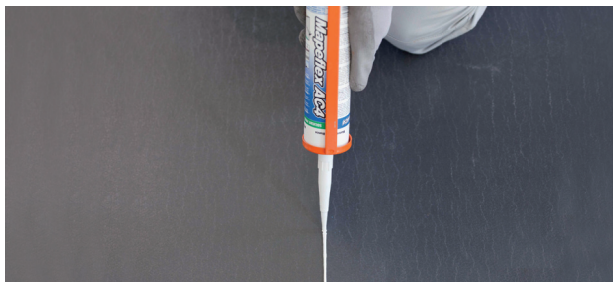
Заливка листов ПВХ герметиком Mapeflex AC4