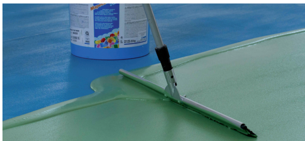
Нанесение слоя цветного акрилового продукта Mapescoat TNS Finish