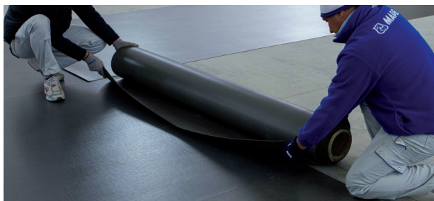
Раскатывание армированного волокнами мата из ПВХ