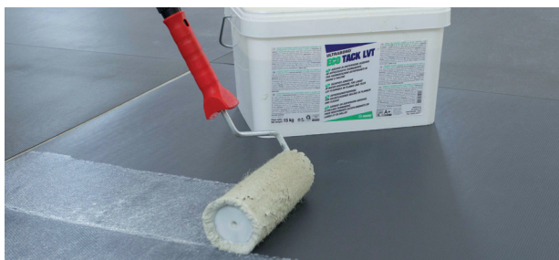
Нанесение клея Ultrabond Eco Tack LVT